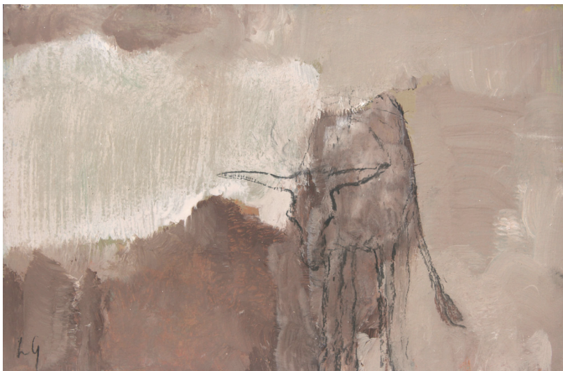
Chimère brune, 2019

Acrylic, pastel on cardboard Acrylique, pastel sur carton